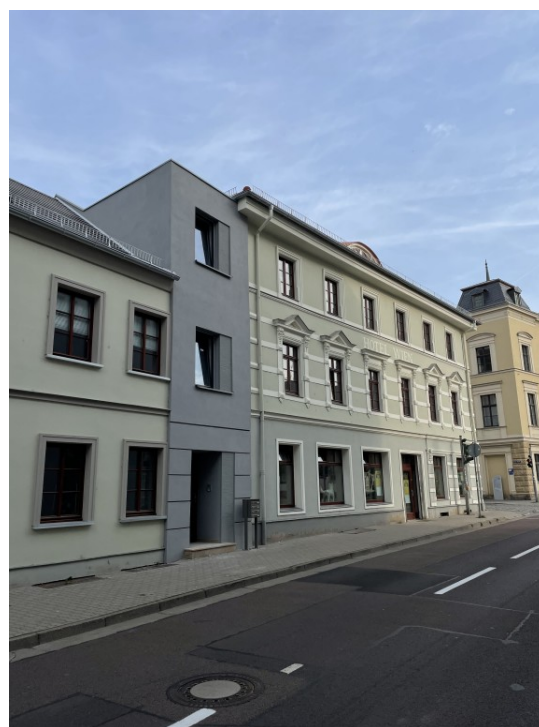
Wohnen in der historischen Altstadt